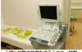
心臓とお腹の診察をする心エコー装置