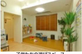
子供たちの遊びスペース