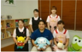
安岡院長とスタッフのみなさん