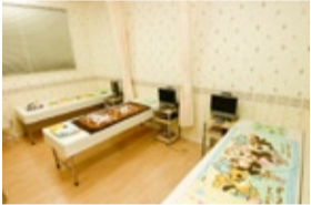
点滴などを行う処置室